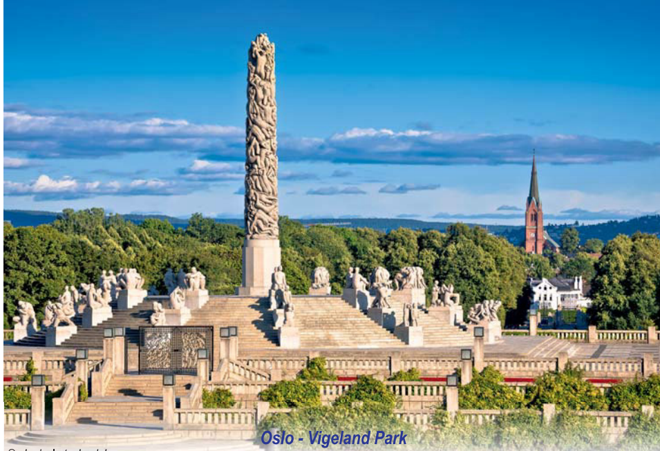
Oslo - Vigeland Park