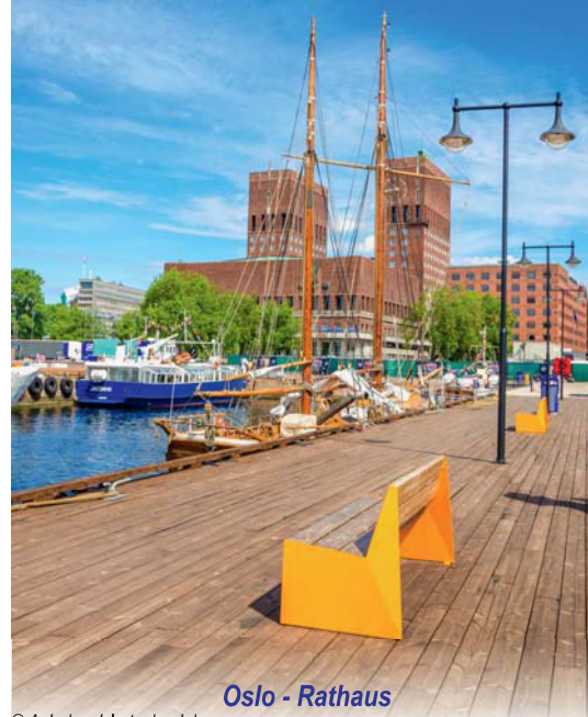
Oslo - Rathaus